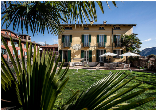
Hotel Villa Carona