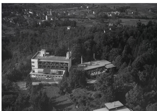
Albergo Monte Verità 1946

Nach dem Frühstück im Hotelgarten nehmen wir an einer Führung teil, die die Geschichte dieser aussergewöhnlichen Anlage beleuchtet und viele Erklärungen zum Monte Verità bietet. In den ersten Jahrzehnten des 20. Jahrhunderts war die Anlage eine bekannte Naturheilanstalt sowie ein Treffpunkt für Lebensreformer, Pazifisten, Künstler, Schriftsteller und Anhänger verschiedener alternativer Bewegungen. Nach 1940 verlor der Ort an Bedeutung. Ein Versuch der Wiederbelebung Ende der 1970er Jahre hatte nur begrenzten Erfolg. Erst in jüngerer Zeit hat sich die Situation deutlich verbessert. Das heutige Ensemble umfasst neben dem Hotel mit Restaurant auch das Museum « Casa Anatta » und ein Kulturgebäude, das von der ETH Zürich als Kongresszentrum genutzt wird.