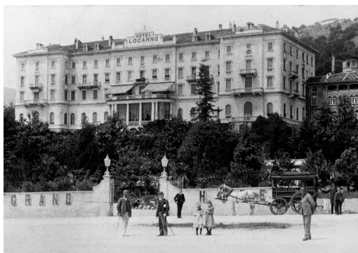
Locarno Grand Hotel Foto kurz nach Eröffnung 1875

Die Reise beginnt am Bahnhof von Locarno, wo das Gepäck im Postauto verladen wird. Anschliessend spazieren wir gemütlich zum Seeufer und tauchen in die Geschichte des Tourismus dieser Gegend ein. Ein bedeutendes Bauwerk ist das Grand Hotel von 1875, das nach einem langen Leerstand endlich renoviert wird. Unter der fachkundigen Leitung der Architektin und Restauratorin Maria Mazza haben wir die Möglichkeit, die Baustelle zu besichtigen. Im beinahe vollendeten Festsaal fand bereits im Dezember 1874 das Bankett zur Eröffnung der Eisenbahnlinie Bellinzona–Locarno der Gotthardbahn statt. Später wurde dort auch das Filmfestival von Locarno gegründet. Der imposante Hotelkomplex wurde im Stil der italienischen Renaissance errichtet und umfasst eine grosszügige Garten- und Parkanlage, die sich unmittelbar über dem gleichzeitig erbauten Bahnhof von Locarno befindet.