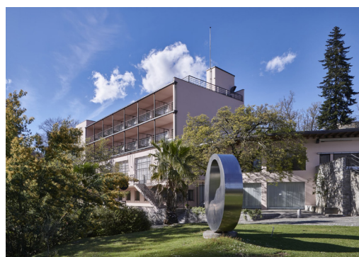
Albergo Monte Verità

Nach dieser aussergewöhnlichen Besichtigung fahren wir mit dem Postauto über den Passübergang Monte Ceneri nach Lugano und gelangen ins historische Zentrum der Stadt. Dort geniessen wir in einem Jugendstil-Café der Altstadt das Mittagessen. Anschliessend entdecken wir das neue Kulturzentrum LAC neben dem ehemaligen Palace-Hotel und erhalten einen Einblick in die Geschichte des Tourismus von Lugano.