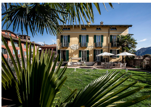
Hôtel Villa Carona