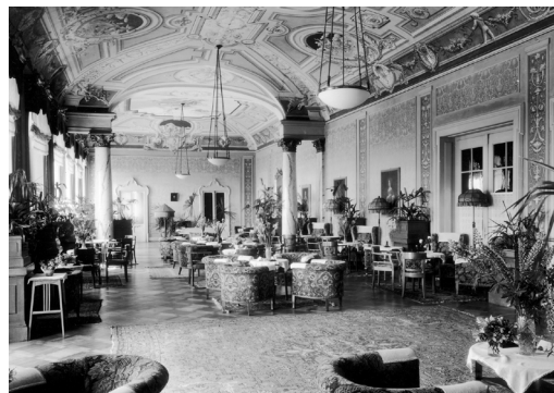
Hall du Grand Hôtel de Locarno vers 1940

Après la visite, nous prenons le car postal jusqu'au Monte Verità via Ascona. Après notre arrivée, nous avons la possibilité de faire une pause dans de précieux jardins ou sur le balcon de notre chambre. Ensuite, nous profitons d'un dîner bien mérité à l'hôtel et y passons la nuit.