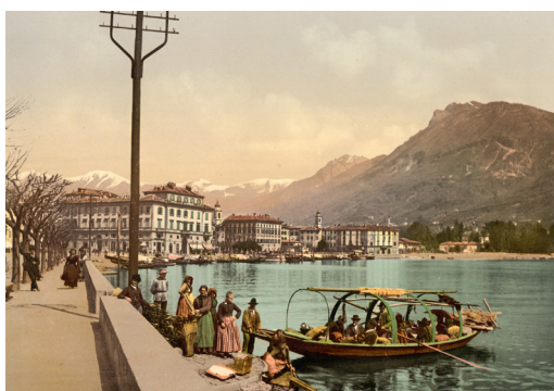
Lugano Quai 1890

Après cette visite exceptionnelle, nous prenons le car postal en passant par le col du Monte Ceneri jusqu'au centre historique de Lugano. Là, nous déjeunons dans un café Art nouveau de la vieille ville. Nous découvrons ensuite le nouveau centre culturel LAC , à côté de l'ancien Palace Hôtel , où nous pouvons voir un aperçu de l'histoire du tourisme à Lugano.