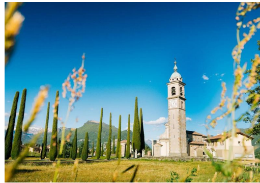
Chiesa di Sant'Abbondio

Après avoir pris notre déjeuner dans une grotte de Montagnola, nous reprenons le car postal pour Lugano, où notre voyage se termine à la gare à 15 heures.