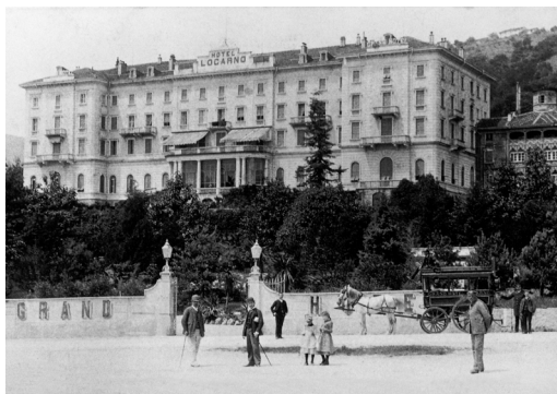
Photo du Grand Hôtel de Locarno peu après son ouverture en 1875