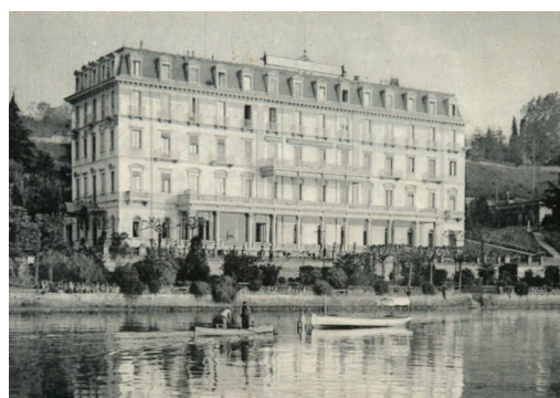
Hôtel Splendide Royal

Nous prenons ensuite le car postal jusqu'au Village des Artistes de Carona, où nous nous installons dans les chambres de l'hôtel Villa Carona et pouvons profiter d'un peu de temps libre dans les magnifiques jardins de la propriété et leur piscine. Ou à travers l'exposition de photos Carona Immagina, visible en extérieur dans tout Carona. Après avoir été accueillis avec un apéritif par la famille propriétaire, nous nous rendons au restaurant de l'hôtel pour un menu typiquement tessinois et passons ensuite la nuit à l'hôtel Villa Carona .