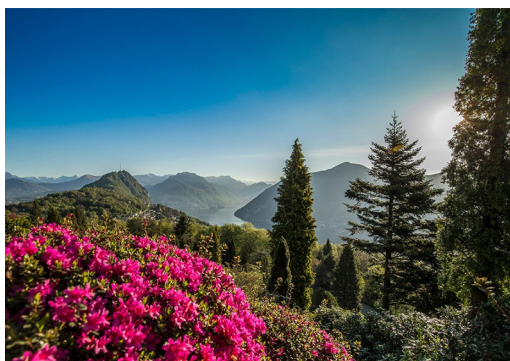
Parco San Grato

Une sélection de vins tessinois est servie pour le dîner à l'hôtel Villa Carona. Ensuite, nous passons à nouveau la nuit à l'hôtel Villa Carona.